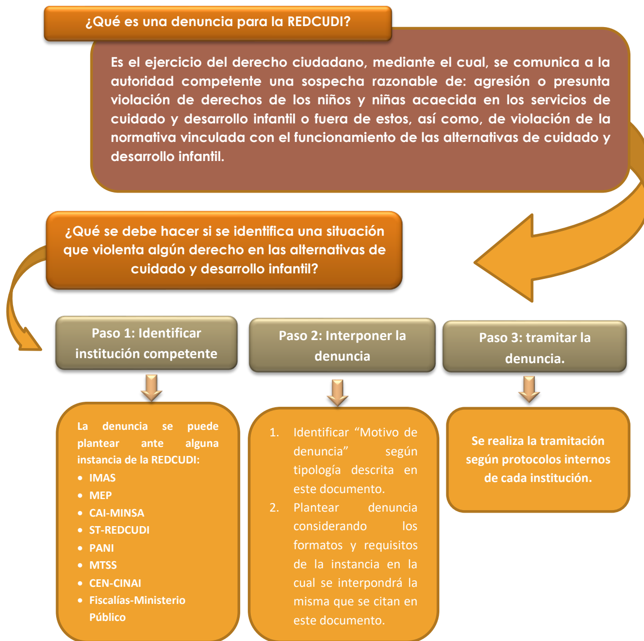
Figura 1. Denuncia en el marco de la REDCUDI